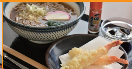
天ぷらそば・うどん 650円