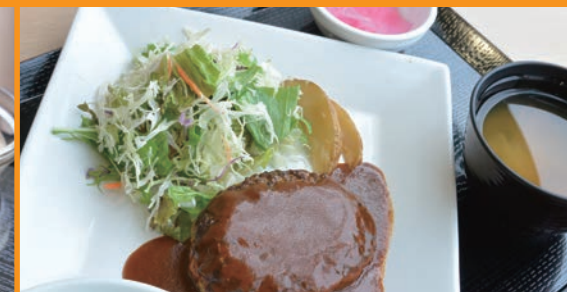
ハンバーグ定食 630円