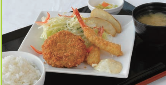
エビフライ&メンチカツ定食 680円

週替わりメニュー 11月12日(月) ~ 11月17日(土) 数に限りがあります。お早目にどうぞ!