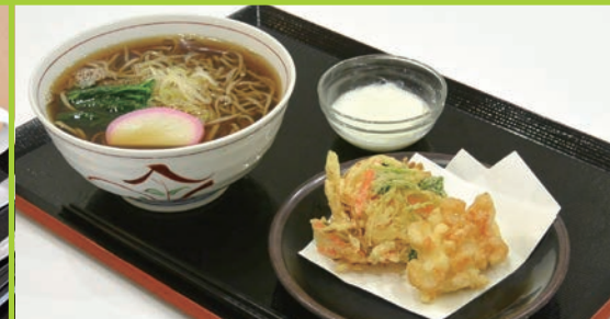
かき揚げそば・うどん 630円